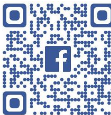
Accès page Facebook