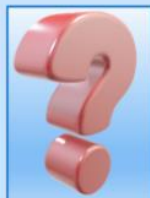
? Haut de Seine